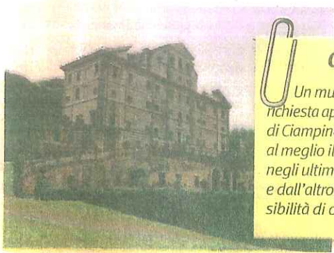
Villa Aldobrandini è uno dei tanti gioielli architettonici nell'area dei Castelli Romani

Su turismo, valorizzazione del territorio ed enogastronomia sono invece concentrati gli sforzi dell'area dei Castelli, che si affida con fiducia al Consorzio Colline Romane, grande realtà socio economica che tutela gli interessi dei Comuni dell'hinterland romano, promuovendo e tutelando, anche a livello internazionale, le risorse locali. Un